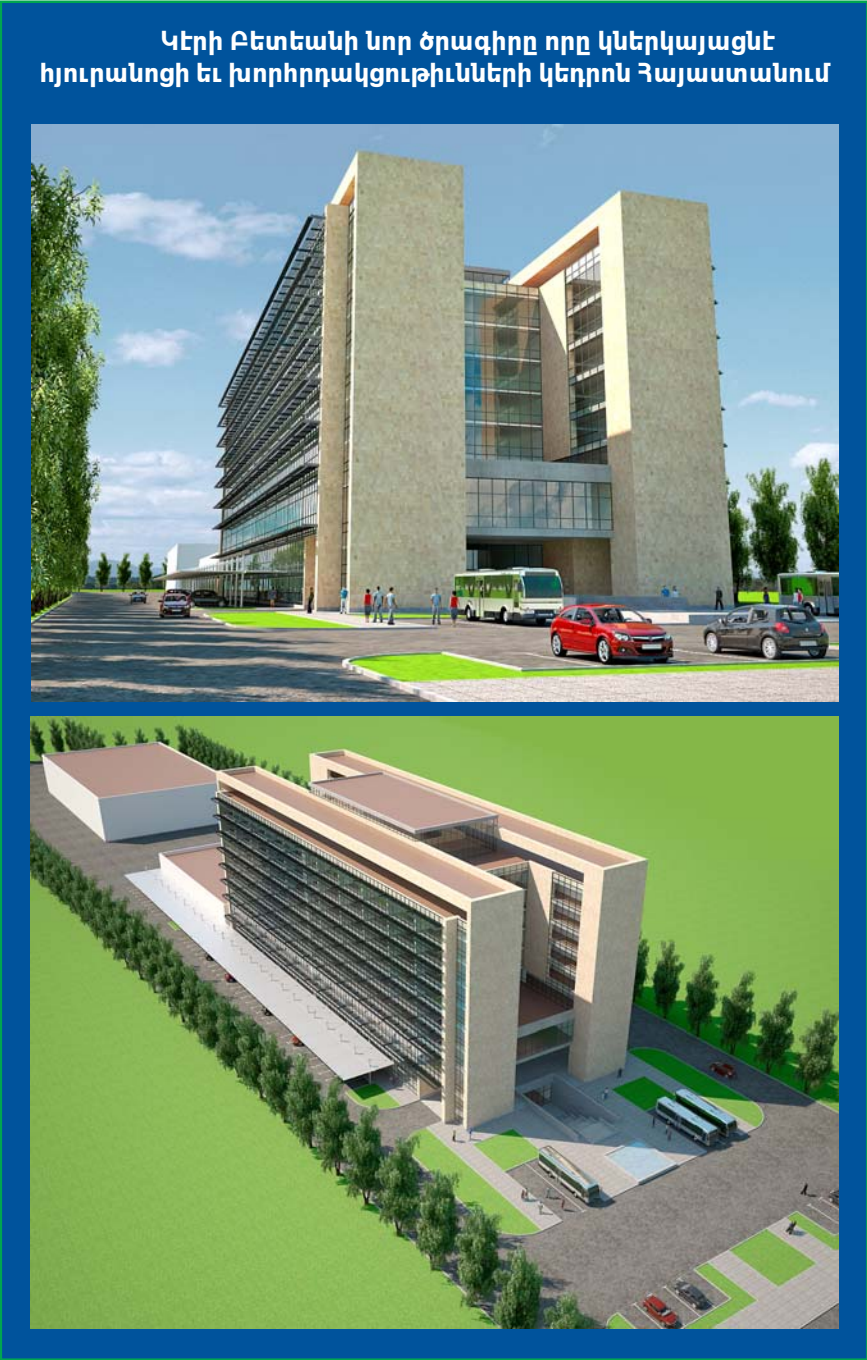
Կերի Բետեանի նոր ծրագիրը որը կներկայացնէ հյուրանոցի եւ խորհրդակցութիւնների կեդրոն Հայաստանում

Այդ ժամանակ, ինչպէս հիմա ան կը կատարէ, Պետեան յաճախականու-