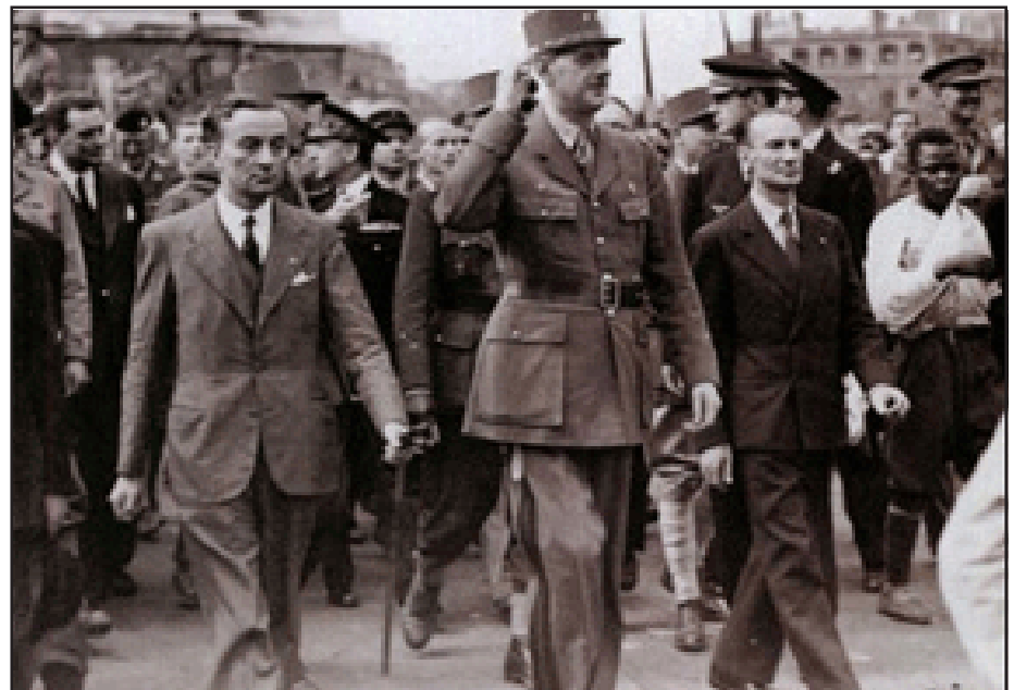
Փարիզի ազատագրութիւն. բազմութիւններ՝ Փլաս տը լա Բոնըրրոտի վրայ, 1944-ի օգոստոս 26-ին:

Տը Կոլի ձախին կանգնած է ժորժ Պիտո՝ Դիմադրութեան Ազգային խորհուրդին ղեկավարը: Աջին տը Կոլի անձնական պատուիրակ Ալեքսանտր Փարոտի: Անոնց ետին կարելի է տեսնել Ֆրանսական ազատ բանակին եւ